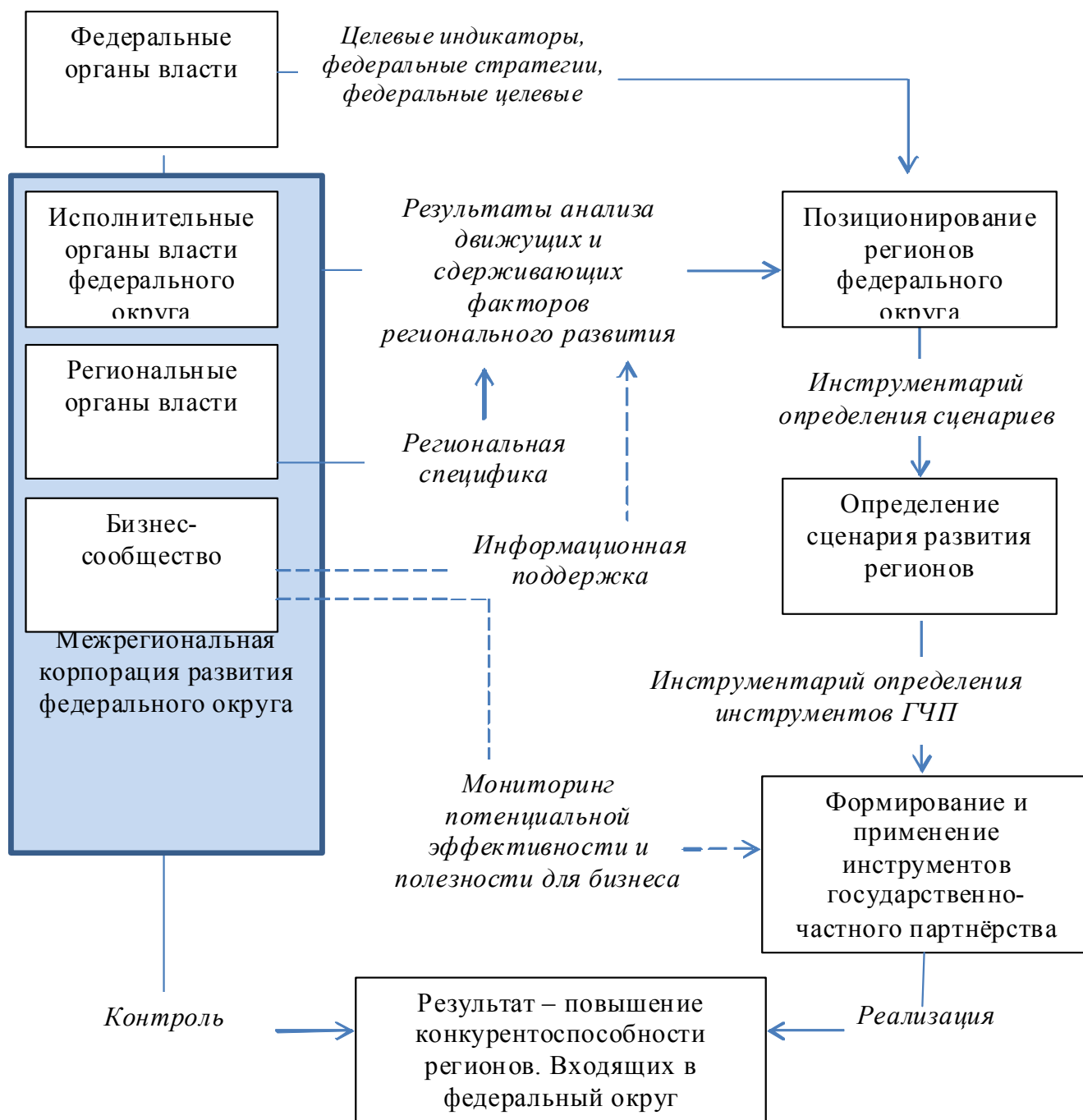
Рисунок 2 – Организационно-экономический механизм формирования и реализации государственной субфедеральной регулятивной политики регионального развития

Центральное место в организационной части предложенного механизма занимает Межрегиональная корпорация (институт) развития федерального округа. Как было сказано ранее, данный институт являет собой интеграцию на принципе корпоративного партнерства органов региональной, окружной, http://ntk.kubstu.ru/file/344