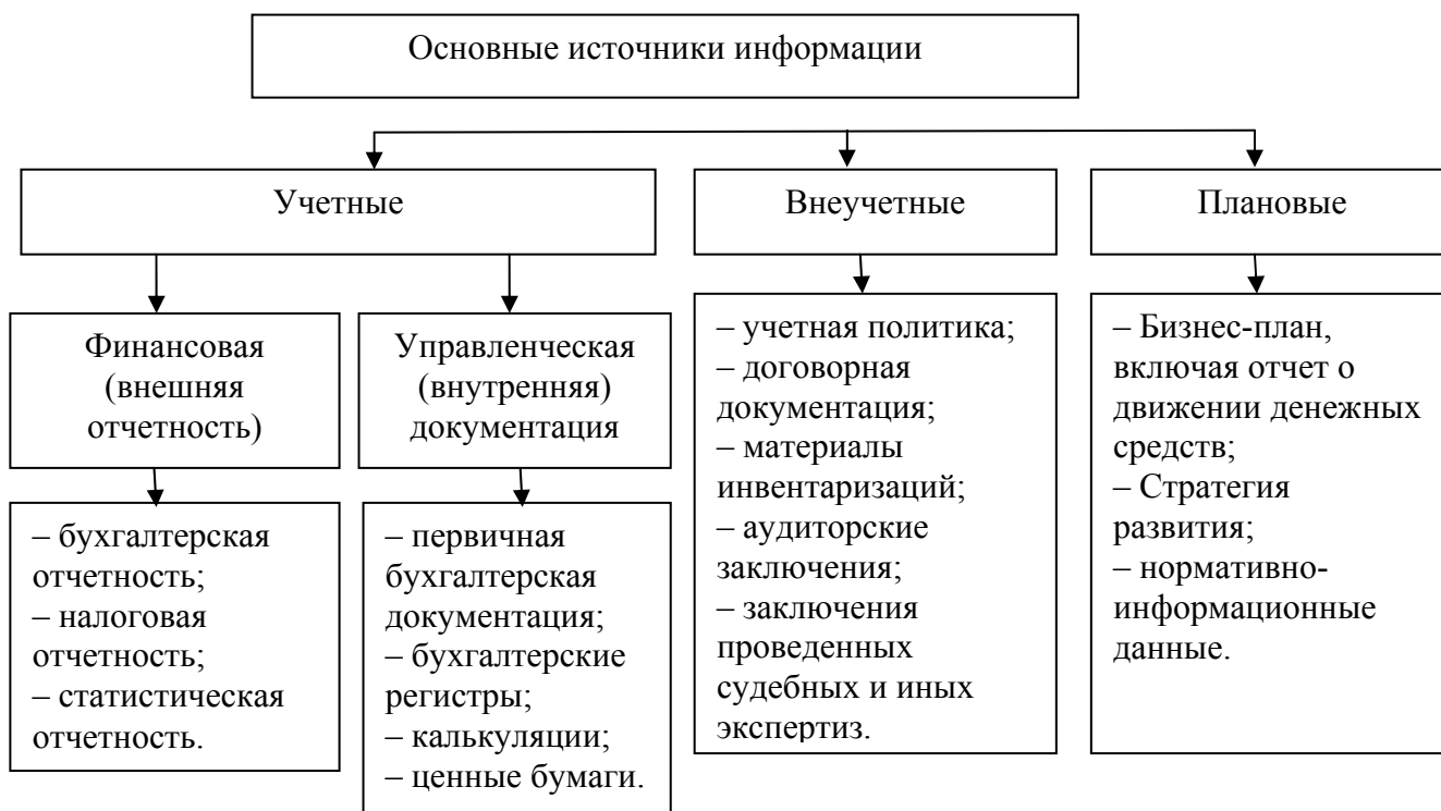
Рисунок 2 – Источники информации экономической экспертизы

Экономическая экспертиза подразделяется на бухгалтерскую и финансово-экономическую экспертизу (рис. 3).