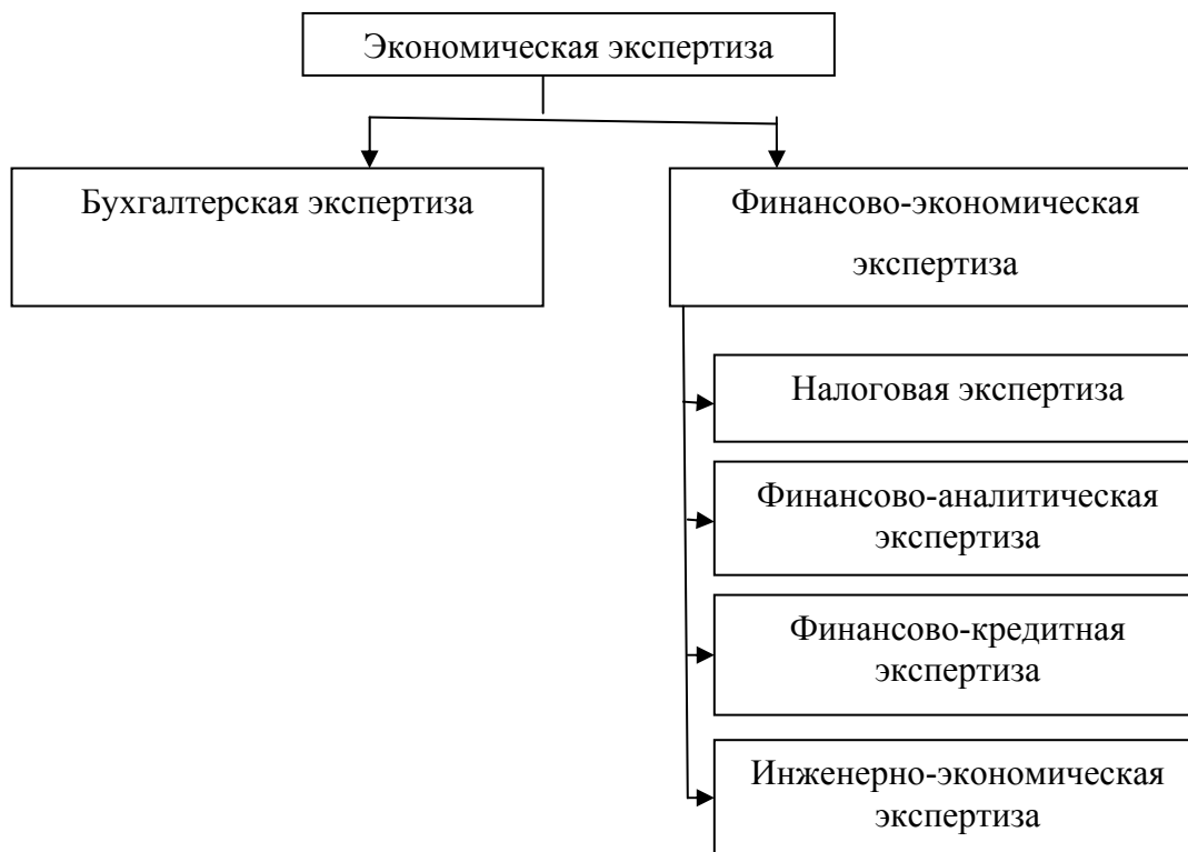
Рисунок 3 – Элементы экспертизы

Экономическая экспертиза подразделяется на бухгалтерскую и финансово-экономическую экспертизу (рис. 3).