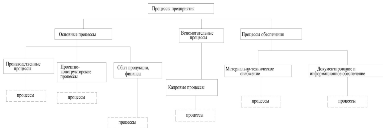
Рисунок 3 - Схема процессов на предприятии.

Исходя из схемы процессов на предприятии, формируется структура, которая документируется. За каждый процесс закрепляется ответственный. Впоследствии изменения доводятся до персонала для ознакомления (рис. 3) [4].