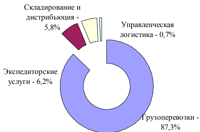
Рисунок 2 – Структура транспортно-логистического рынка города Краснодара по видам услуг, 2014 г., %

По итогам 9 месяцев 2015 г. темпы роста рынка транспортно-логистических услуг снизились до 4,5% в результате негативной динамики в сегменте грузоперевозок.