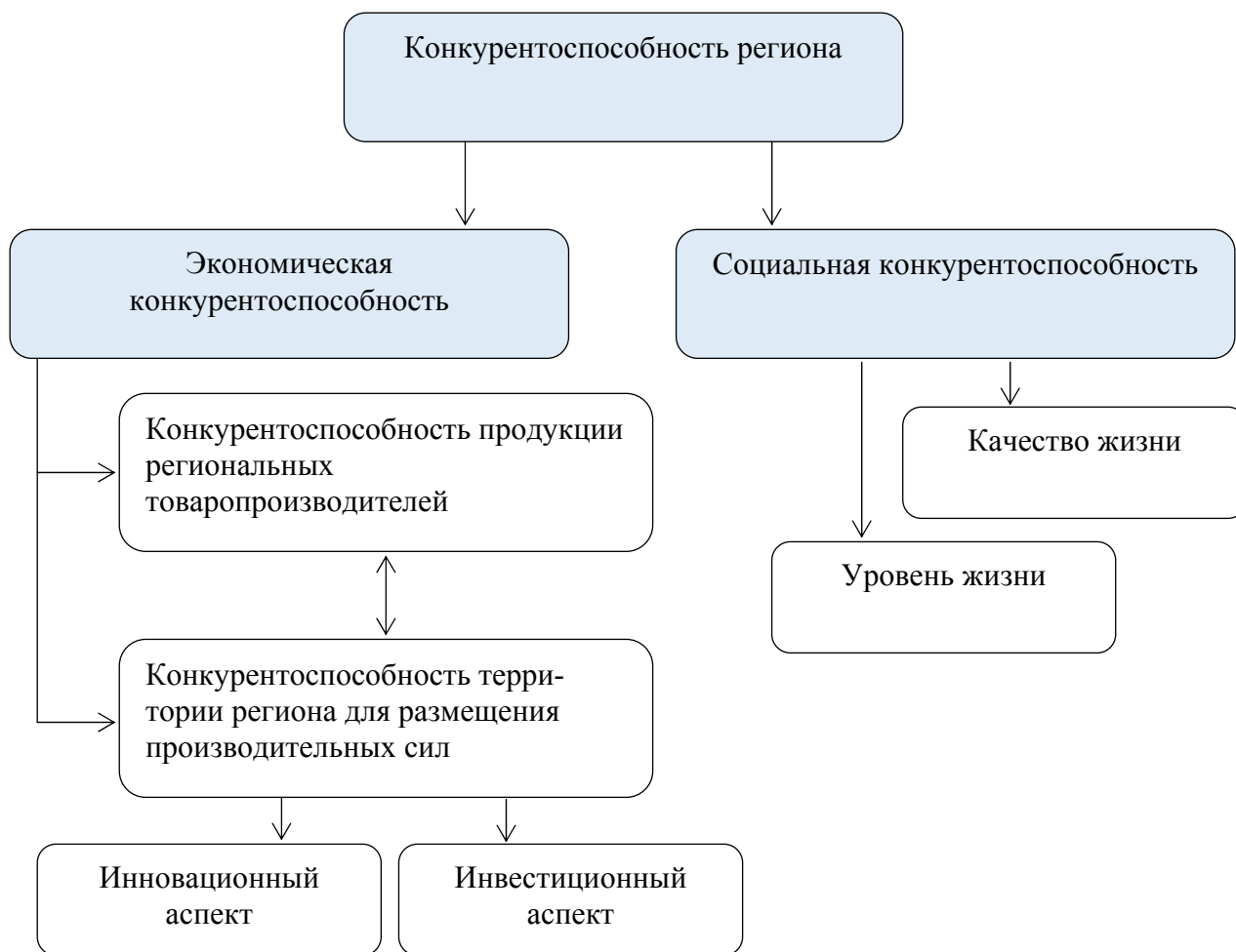
Рисунок 2 – Фрагментация понятия региональной конкурентоспособности (разработано автором).

Изучение отечественных и зарубежных ученых, которые занимаются проблемами повышения региональной конкурентоспособности, позволяет сделать вывод относительно отсутствия единственного подхода к определению этого понятия и факторов его определяющих.