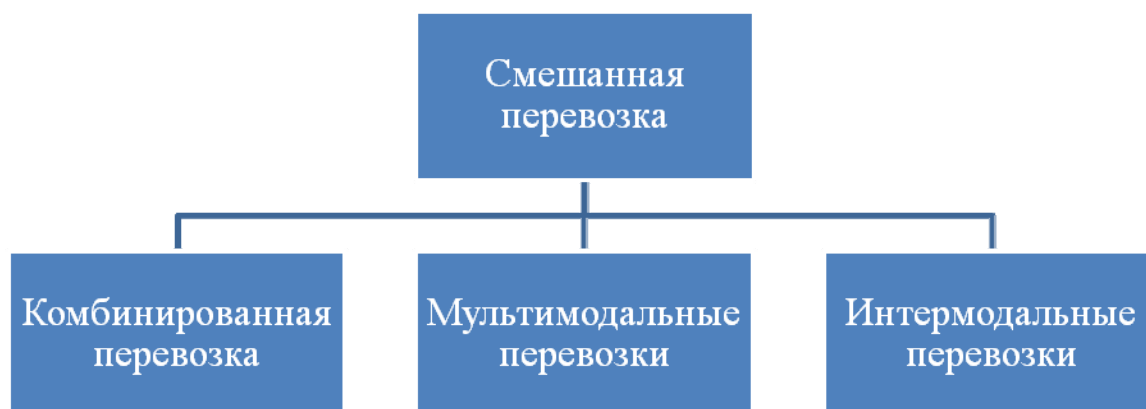
Рисунок 2 – Классификация смешанных перевозок грузов по видам

Смешанные перевозки грузов, бесспорно, один из простейших способов свести к минимуму временные и финансовые затраты на транспортировку товара из любой точки земного шара. Главное в осуществлении перевозки таким способом – выбрать оптимальный маршрут и набор транспортных средств. На рисунке 2 представлена классификация смешанных перевозок грузов по видам.