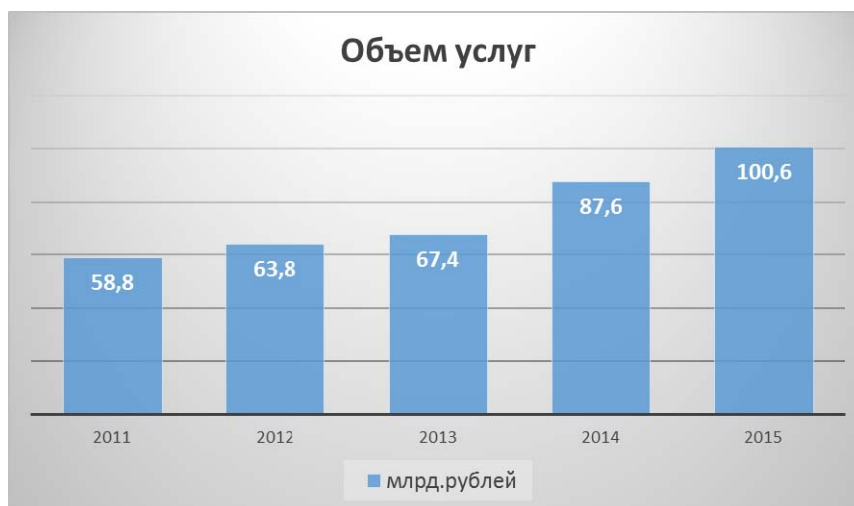
Рис.3 Объем услуг курортно-туристского комплекса Краснодарского края, млрд.руб. (данные Краснодарстата).

Объем услуг курортно-туристского комплекса Краснодарского края за 2011-2015 годы представлен на рисунке 3 [3].