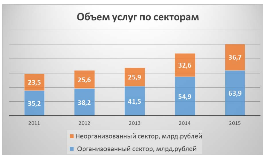
Рис.4 Доходы (объем услуг) санаторно-курортного и туристского комплекса Краснодарского края в разрезе организованного и неорганизованного секторов, млрд.руб., (данные Краснодарстата).

Динамика доходов (объема услуг) отрасли за 5 лет в разрезе коллективных и индивидуальных средств размещения (по секторам) представлена на рисунке 4 [3].