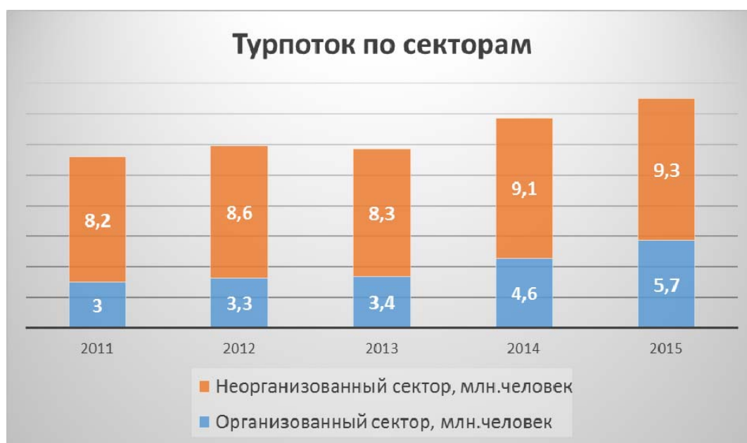
Рис.2 Динамика турпотока Краснодарского края в разрезе организованного и неорганизованного секторов, млн.человек (данные Краснодарстата).

Туристский поток за 5 лет, согласно официальным статистическим данным, в разрезе организованного сектора (туристы, размещенные в коллективных средствах размещения) и неорганизованного сектора (самостоятельные туристы, однодневные посетители и экскурсанты) представлен на рисунке 2 [3].