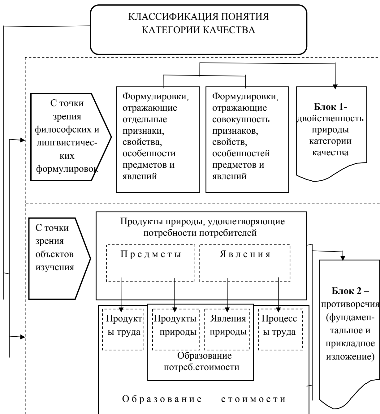
Рисунок 1 – Классификация понятия категории качества (* разработано автором)

Двойственный подход к изучению природы категории качества выступает как инструмент исследования противоречий внешних и внутренних свойств предмета [9, с. 65]. Природа качества предметов и явлений второй группы зависит от соотношения между степенью полезности и величиной заложенного общественного труда, то есть от соотношения потребительной стоимости и стоимости.